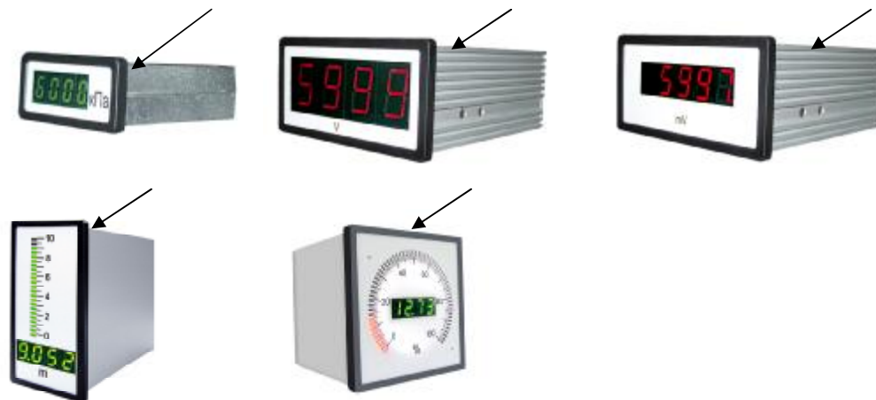
Рисунок 1 – Вид амперметров и вольтметров цифровых Ф1762-АД

Оттиск поверительного клейма, при положительных результатах поверки, наносят на корпус приборов.